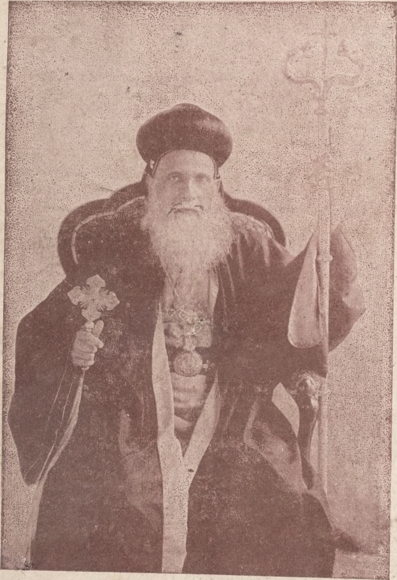
നി. വ. ടി. ശ്രീ. മാർ തിമോത്തിയോസ് മെത്രാപ്പോലീത്താ തിരുമനസ്സുകൊണ്ട്.

Handwritten signature or name in Malayalam script.